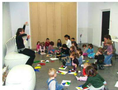
Visite – atelier au musée dans le cadre du service éducatif