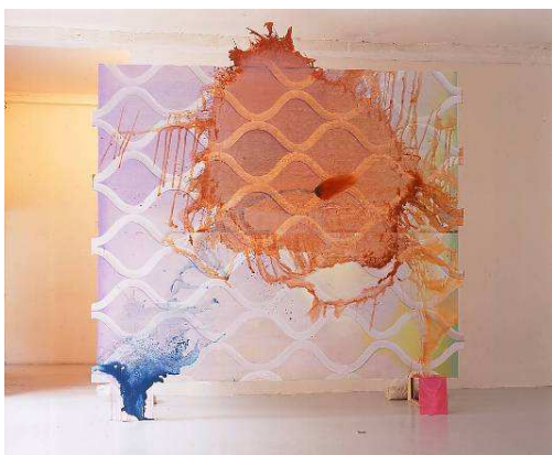
Carlos Kusnir, Sans titre , 2003, acrylique sur bois, 345 x 310 cm, Collection Fonds communal d'art