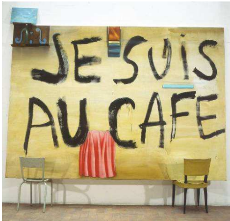
Carlos Kusnir, je suis au café , 1986, technique mixte, 246 x 310 cm, Collection Fondation Cartier pour l'art