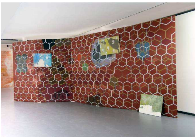
Carlos Kusnir, Sans titre , 2007, Acrylique sur bois, 505 x 272 x 220 cm, Collection Frac PACA