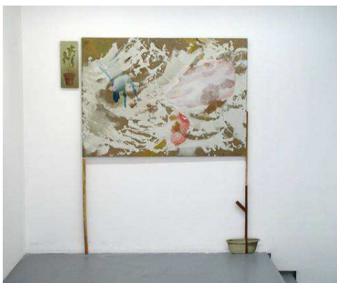
Carlos Kusnir, Sans titre , 2004, acrylique sur bois, 172 x 204 cm, Collection privée, Bruxelles